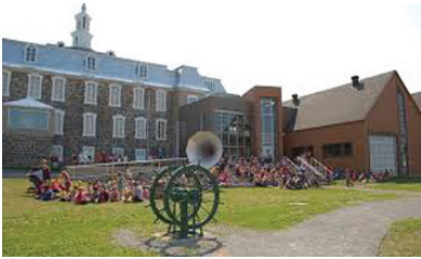
Musée maritime du Québec