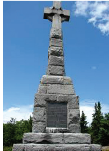
Mémorial des Irlandais à Grosse-Île