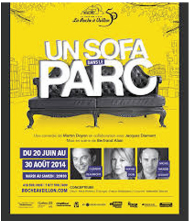
Affiche de la comédie « Un sofa dans le parc »