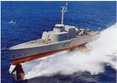
L'Hydroptère Bras d'Or