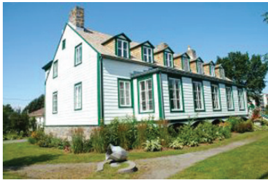
Maison Étienne-Pascal Taché